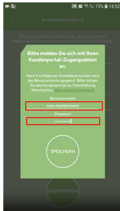
Step 6: Ihren Kundenportal-Benutzernamen und Ihr Kundenportal-Passwort eingeben.