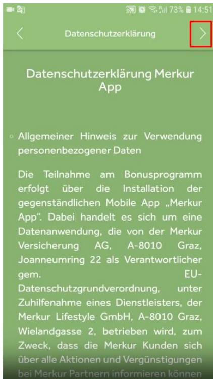
Step 3: Datenschutzerklärung lesen und weiter.