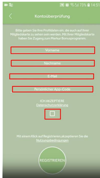
Step 4: Daten eingeben. Vorname, Nachname, e-Mail Adresse sowie persönlicher App-Code.