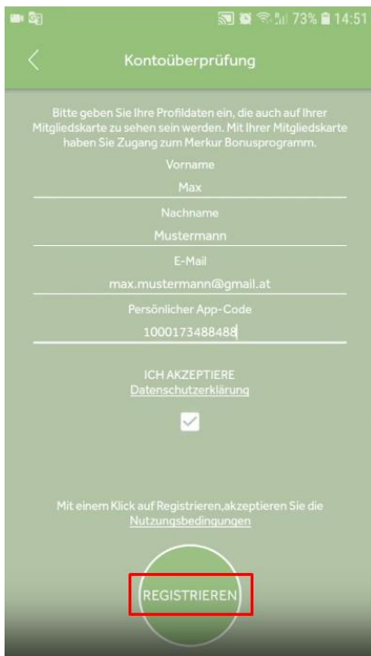
Step 5: Registrieren